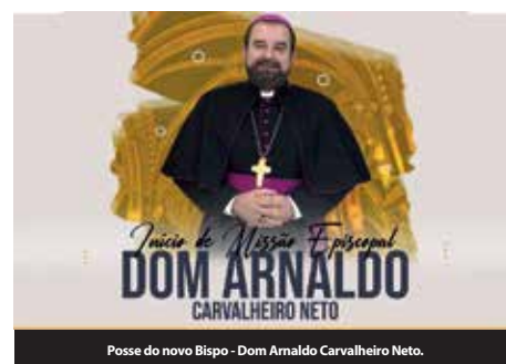
Posse do novo Bispo - Dom Arnaldo Carvalheiro Neto.