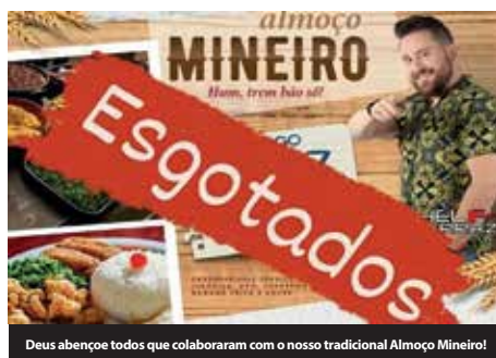
Deus abençoe todos que colaboraram com o nosso tradicional Almoço Mineiro!