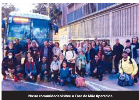
Nossa comunidade visitou a Casa da Mãe Aparecida.